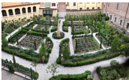
Giardino del Vescovado di Imola