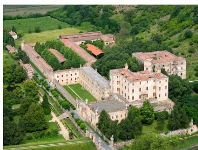
Castello del Catajo