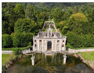
Giardino di Valsanzibio