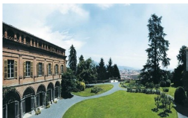
Palazzo La Marmorata