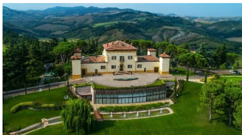
Palazzo di Varignana